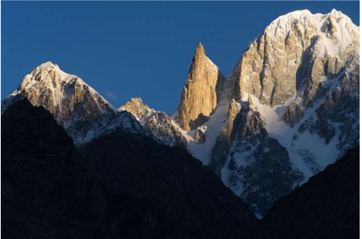
Lady Finger (6000m), Hunza Peak (6227mชาวสุด)

เช้า ปลุกตื่นเก็บแสงเช้าบริเวณจุดชมวิว Eagle Nest เพื่อชมพระอาทิตย์ขึ้นจะเห็น วิวพานอรามาของ เทือกเขาสีขาว สูงมากกว่า 7,000 เมตร Rakaposhi,Diran,Golden Peak,Ultar I Ultar II และ Lady finger